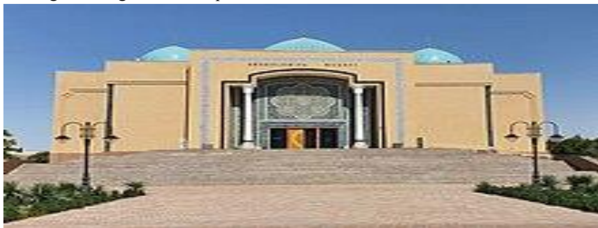
Termiz arxeologiya muzeyi

Termiz arxeologiya muzeyida Surxondaryo viloyatida olib borilgan arxeologik qazishmalar natijasida topilgan topilmalar saqlanadi. Viloyat Arxeologiya muzeyi O'zbekiston Respublikasi Prezidentining 1998-yil 12 yanvardagi "Muzeylar faoliyatini tubdan yaxshilash va takomillashtirish to'g'risida"gi Farmoni, Vazirlar Mahkamasining 1998 yil 5 martdagi "Muzeylar faoliyatini qo'llab-quvvatlash masalalari to'g'risida" gi 98-sonli va 1999 yil 27 dekabr"dagi Termiz shahrining 2500 yilligini nishonlashga tayyorgarlik ko'rish va uni o'tkazish to'g'risida" gi 545-sonli qarorlari asosida tashkil etildi.