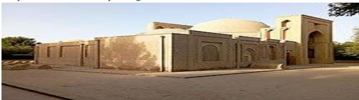
At Termiziy majmuasi 2

kunda bu majmua vohaliklar va viloyat mehmonlari uchun asosiy ziyorat manzilgohlaridan biri hisoblanadi. Masjid, maqbara, xonaqoh, qorixona kabi binolardan iborat bo'lgan. Majmuaning umumiy maydoni 28.0x29.0 metr bo'lib, shundan maqbara 5.10x4.70 metrni tashkil etadi. Rivoyat qilinishicha dastlab xom g'ishtdan xonaqoh (9-asr) bunyod etilib, Hakim Termiziy shu yerda yashab mudarrislik qilgan. Binodan keng hovlining bir qismi, qalin devor to'siq va shimoli-sharqiy burchagida uncha katta bo'lmagan yerto'lasimon hujra saqlangan. Vaqtlar o'tishi bilan qabr ustiga, xonaqohning janubi-g'arbiy burchagida xom g'ishtdan janubga qaratib maqbara bunyod etilgan (9-asr). Termiziy maqbarasi xalq orasida ulug'lanib avliyo qabri, muqaddas ziyoratgoh sifatida e'zozlangan. Keyinchalik maqbaraning sharqiy devoriga tutashtirib kichik qorixona va o'g'li alHakim Abdulloh maqbarasi (10-asr), shim.da uncha katta bo'lmagan hovliga qaragan 3 gumbazli, ravokli yo'lak ko'rinishidagi namozgoh masjidi (11 —12-asrlar) hamda bir qator qo'shimcha xonalar qo'shilgan.